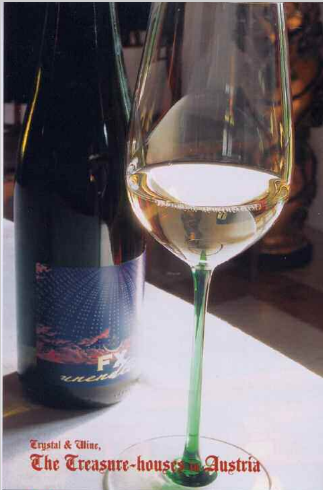
Crystal & Wine, The Treasure-houses of Austria